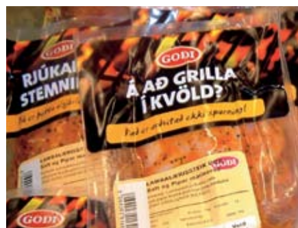
Umtalsverð aukning hefur verið í sölu á framleiðsluvörum Norðlenska á fyrstu mánuðum þessa árs í samanburði við sömu mánuði í fyrra.