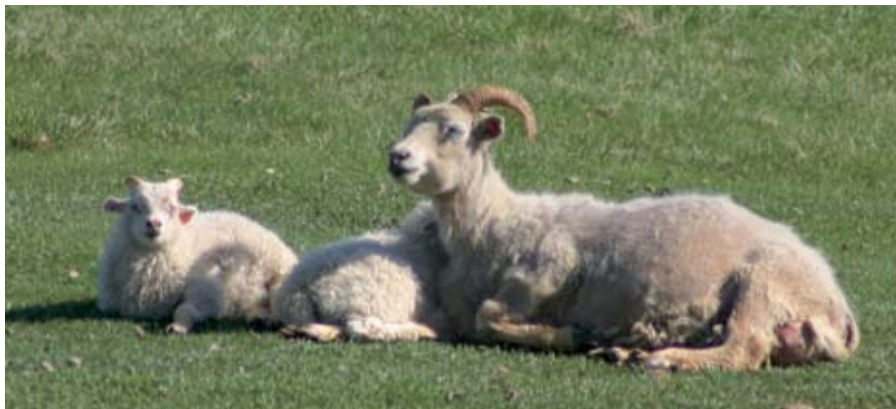
Almennt gekk sauðburður nokkuð vel á starfssvæði Norðlenska, enda tíðarfarar síðari hluta maímánaðar einstaklega gott.

„Sauðburðurinn hefur almennt gengið vel. Veðrið hefur leikið við okkur síðari hluta maí og það hefur að sjálfsögðu létt