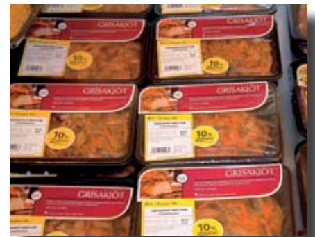
Norðlenska framleiðir nýja vörulínu í ferskvöru fyrir nýja verslun Nettó á Akureyri. Hér má sjá hluta af þessari vörulínu í kæliborðinu í Nettó.