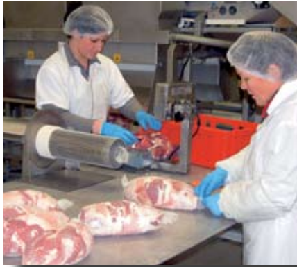
Úr vinnslusal Norðlenska á Húsavík.

Í aðalfundarsamþykktinni segir að samþykkt þessa frumvarps muni leiða til mikillar og alvarlegrar röskunar á innlendri landbúnaðarframleiðslu með ófyrirséðum afleiðingum fyrir atvinnulífið í landinu. Um sé að ræða enn eina stjórnvaldsaðgerð á skömmum tíma, sem breyti á róttækan hátt rekstrar- og markaðsumhverfi innleðrar landbúnaðarframleiðslu til hins verra. „Helstu aðgerðir aðrar af þessu tagi eru mikil lækking innflutningstolla í ársbyrjun 2007 og væntanlegt brottfall útflutningsskyldu á kindakjöti. Þegar þessar aðgerðir bætast við skyndilegar og stórfelldar hækkanir á aðföngum til landbúnaðar og vöxtum má augljóst vera að mikið hættuástand er að skapast.“