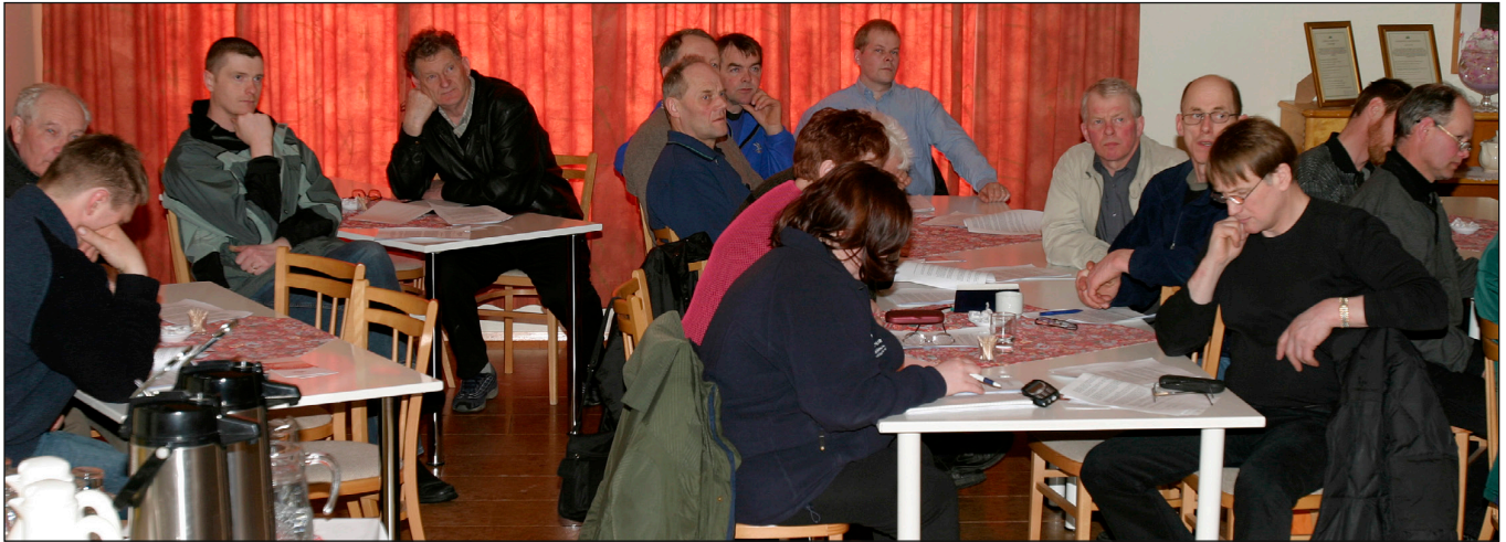
Frá fyrsta formlega fundi Búsældar og Norðlenska. Hann var haldinn þann 3. maí árið 2004 að Narfastöðum í Reykjadal.