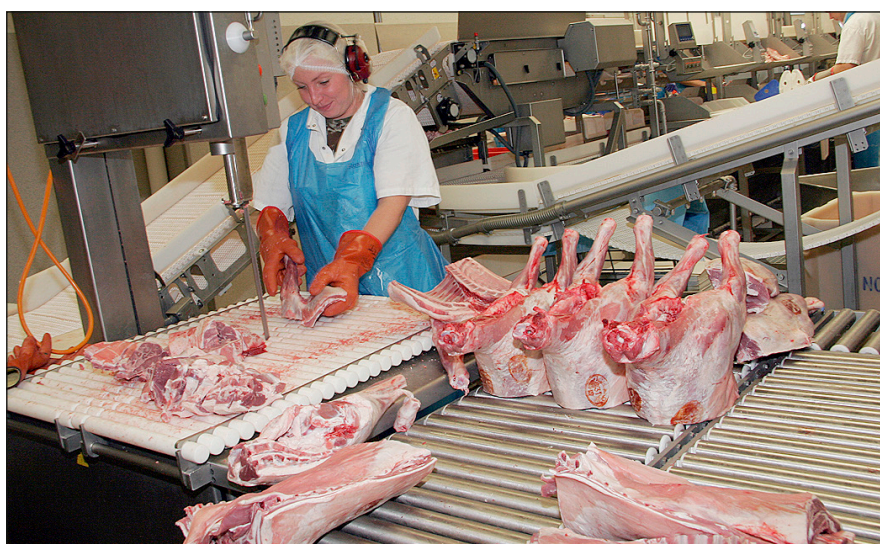
Handtökin eru mörg í húsum Norðlenska í sláurtíðinni. Myndin er tekin á Húsavík.

Í september 2004 kom skyndilega upp sú staða að Sláurfélaginu Búa, sem annaðist slátrun á Höfn í Hornafirði var synjað um afurðalán og Norðlenska tók nær fyrirvaralaust við slátrun þar. Stjórnir Búsældar og Norðlenska ákváðu þá að gefa innleggjendum þar kost á sömu kjör-