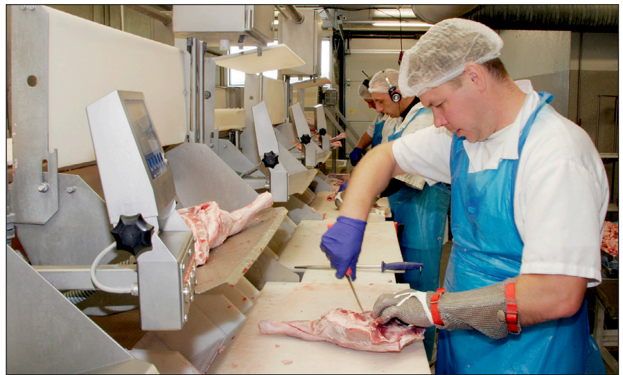
Kjöt skorið á vinnslulínunni frá Marel á Akureyri.

Að tilmælum Landsbankans var ráðist í hlutfjár aukningu á árinu 2008 og bar hún þokkalegan árangur. En nú var skammt í þær miklu sviptingar sem hrun fjármálakerfisins haustið 2008 leiddu af sér. Of langt mál yrði að rekja hér og nú öll áhrif þess á Norðlenska og Búsæld en efnahagur þeirra mátti kallast hrynja. Alltaf tókst þó að standa í skilum við lánveitendur, og hluthafar stóðu þétt að baki félagsins og stjórnenda þess. Þetta harða él birti þó upp um síðir og að því loknu hafa Búsæld og Norðlenska náð á ný góðri afkomu og góðri efnahagsstöðu enda allan tímann stefnt kappsamlega að því marki. Líklega má segja að hrúnið hafi valdið þriggja ára töf á þeirri leið. Verðtrygging lána olli t.d. Búsæld tölverðum búsiþjóm og lengdi til muna endurgreiðslutíma lána.